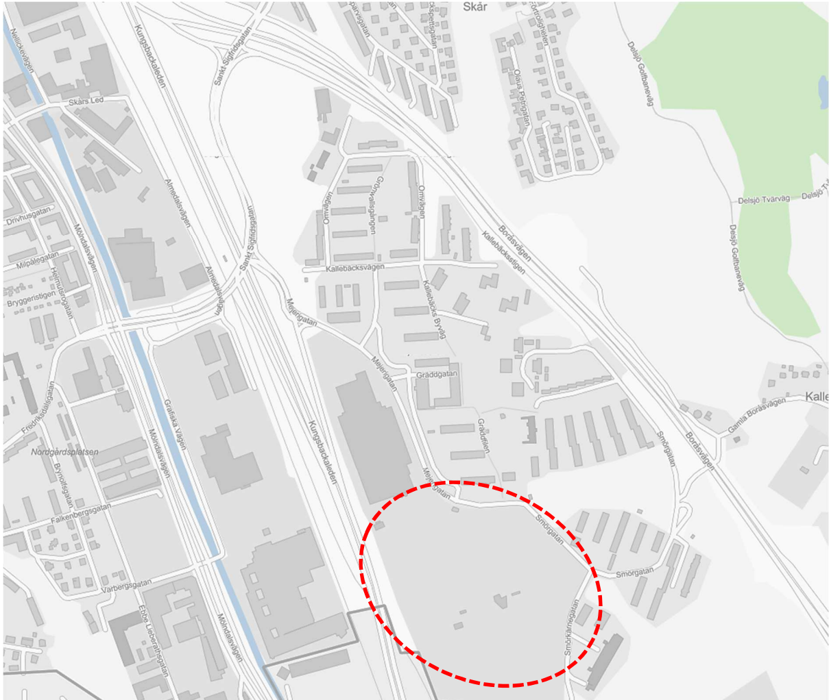
Figur 1. Detaljplanområdets läge i Kallebäck

Inom ramen för arbetet med detaljplan för bostäder och verksamheter vid Smörgatan i Kallebäck (som ingår i BoStad2021) utreds vilka konsekvenser som planerad utbyggnad kan få på trafiken i Kallebäcksmotet. Planområdets läge i Kallebäck visas i figur 1 nedan.