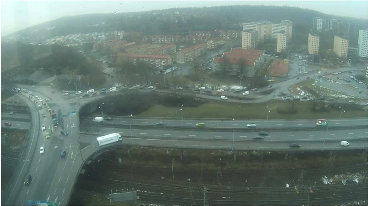
Figur 3: Trafiksituation i Kallebäcksmotet kl 7:55 en vardagsmorgon i mars 2017.