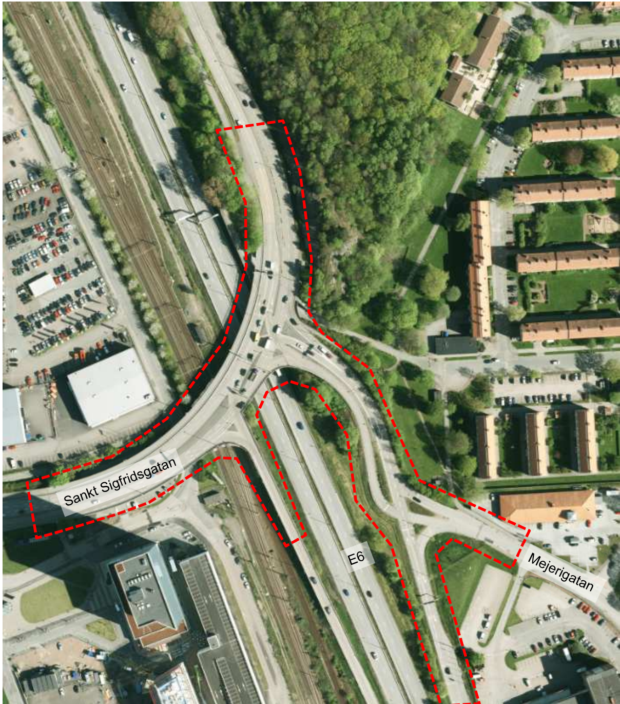
Figur 2. Avgränsning av utredningsområdet (röd markering).

De delar av Kallebäcksmotet som ingår i analysen utgörs av avfarten norrut från E6, Smörgatans anslutning till denna avfart, samt de två korsningarna på Sankt Sigfridsgatan som är belägna på bron ovanför E6. De delar som rör Sankt Sigfridsgatans koppling till väg 40 har inte tagits med i utredningsarbetet då de i detta sammanhang ligger för perifert i relation till den tillkommande bebyggelsen. Dock kan eventuell påverkan på dessa mer perifera delar översiktligt bedömas utifrån genomförda analyser.